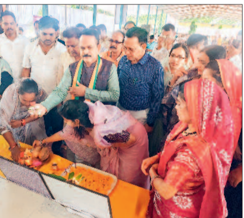
पंचायत गोपालपुर के ग्रामीणों ने सुशासन तीहार में जाकर अनेकों आवेदन दिए अनुसूचित जाति मुहल्ला में गुरु घासीदास परिसर, गली एवं तांबा तालाब पार में कांक्रैटीकरण, मंगल भवन