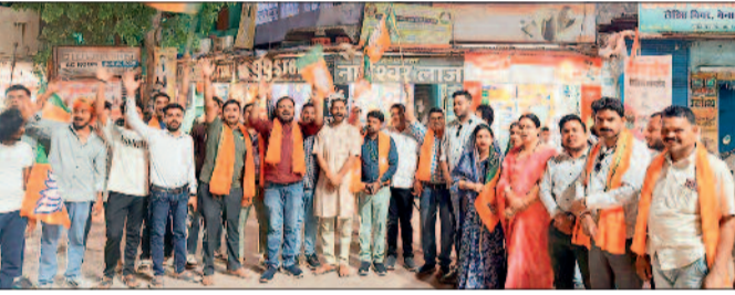
प्रधानमंत्री नरेंद्र मोदी जी के नेतृत्व में देश निरंतर विकास की ओर अग्रसर है और

वातावरण जश्नमय रहा और नगर में उत्सव का माहौल देखने को मिला। इस चुनावों में पार्टी की प्रचंड विजय के उपलक्ष्य में भव्य उत्सव मनाया गया। इस अवसर पर कार्यकर्ताओं ने उत्साह उमंग और जोश के साथ आतिशबाजी की तथा झालमुड़ी का वितरण कर खुशी साझा की। कार्यक्रम में उपस्थित कार्यकर्ताओं और नागरिकों ने इसे ऐतिहासिक जीत बताते हुए एक-दूसरे को बधाई दी। पूरा